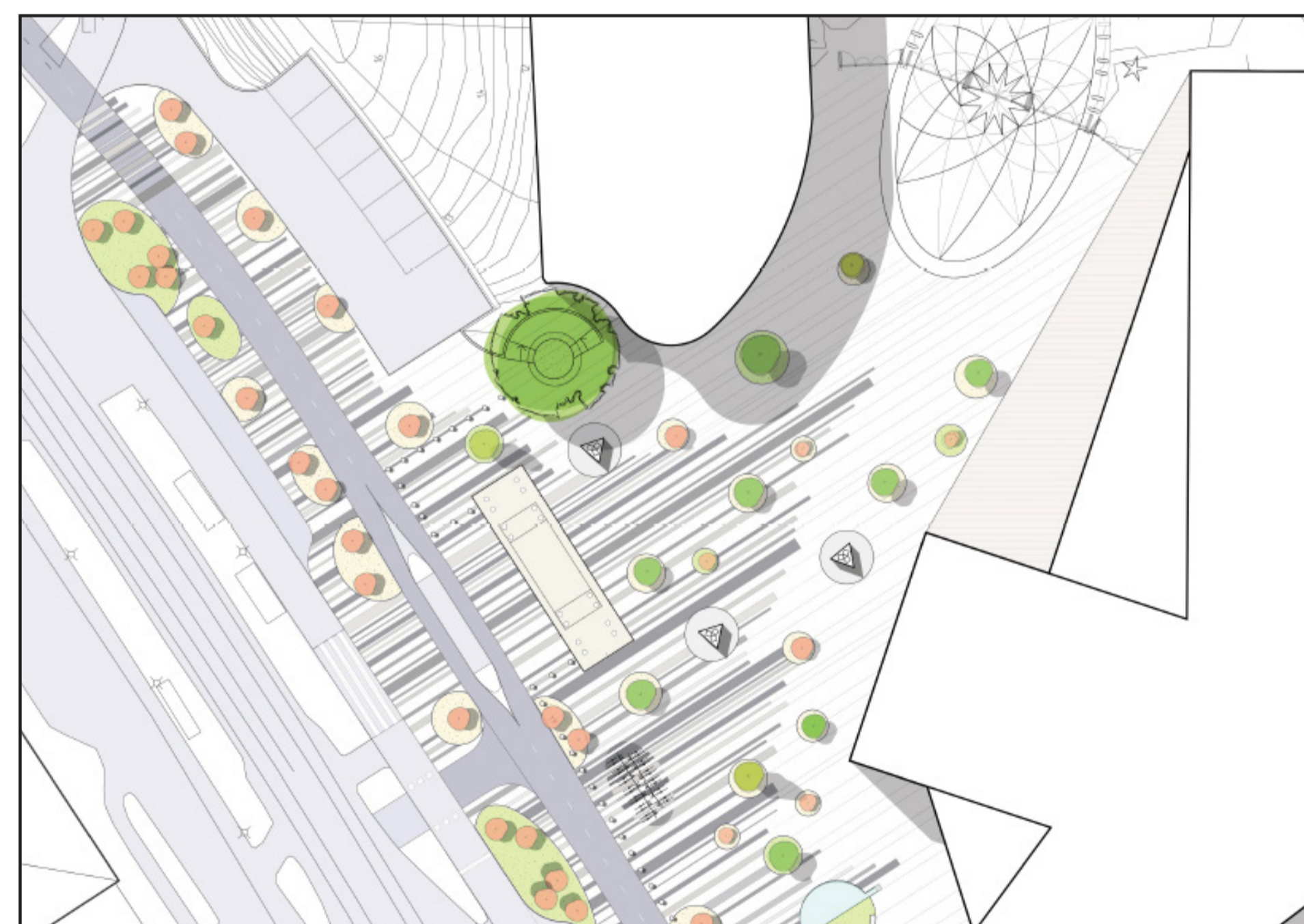
Exempel på utformning av platsbildningar längs Mölndalsvägen med aktuell parkeringsyta i bildens nordvästra hörn. Illustration gjord av COWI.